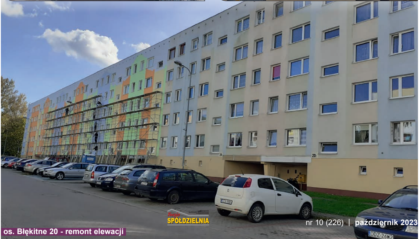
os. Błękitne 20 - remont elewacji