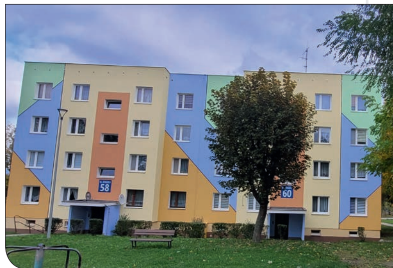
Staszica 58-60 po remoncie elewacji