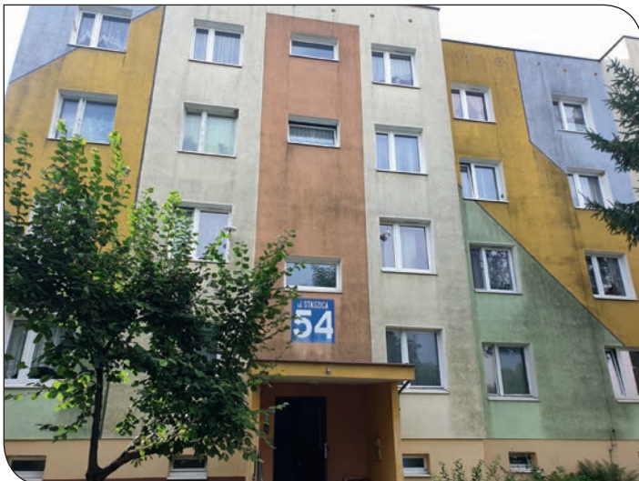
Staszica 54-56 - elewacja przed remontem