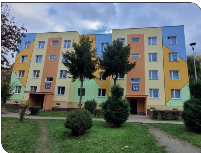
Staszica 54-56 po remoncie elewacji