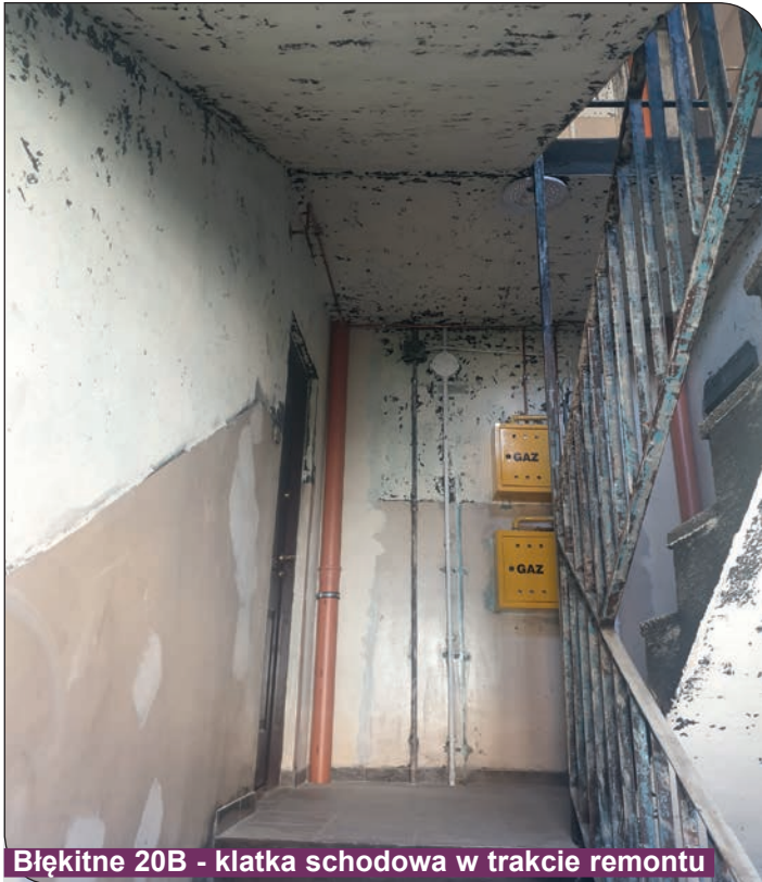
Błękitne 20B - klatka schodowa w trakcie remontu

całego budynku znajdującego się na osiedlu Błękitnym 20B, wymieniono okna oraz parapety wewnętrzne na klatce schodowej w klatce B, które zostały zniszczone w wyniku pożaru, jak również rozpoczęto remont klatki schodowej po pożarze.