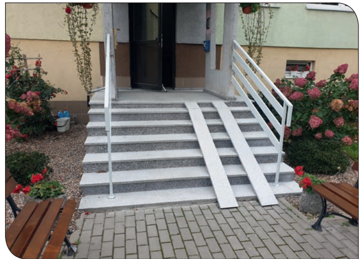
os. Różane 4 - schody po remoncie