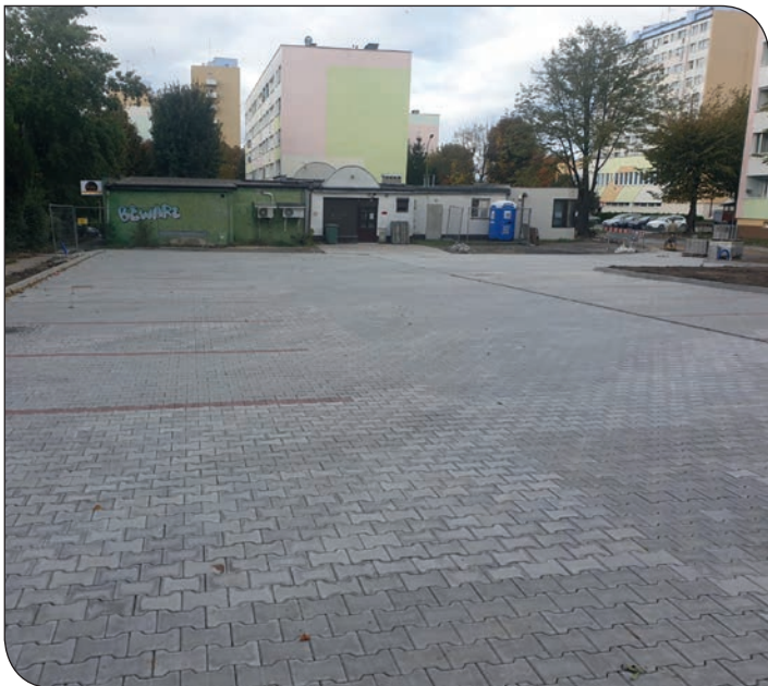
os. Jasne - budowa parkingu

Na osiedlu Różanym 21 i 22 trwają prace związane z remontem ganków.