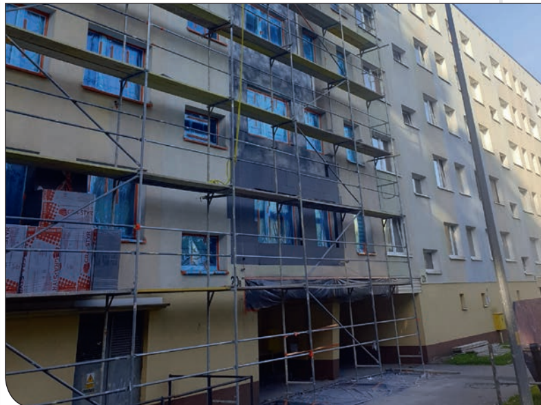
Błękitne 20 - w trakcie remontu

Na osiedlu Błękitnym 20 wykonywany jest remont elewacji.