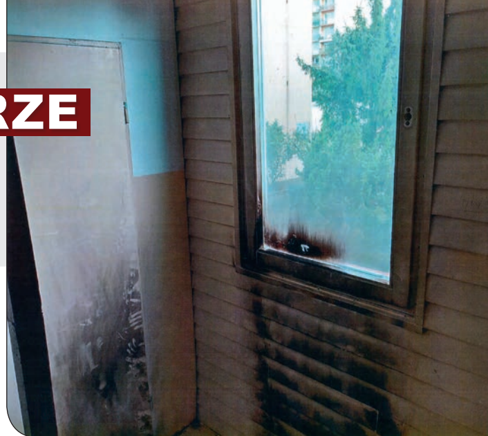
Różane 22b po pożarze

w celu ugaszenia palących się elementów tam zgromadzonych. Spółdzielnia Mieszkaniowa wykonała wymianę spalonego okna oraz oczyszczona i pomalowana została ściana z sidingu.