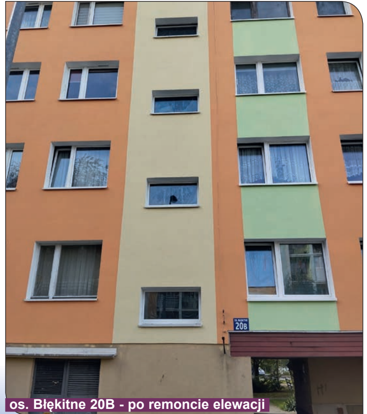
os. Błękitne 20B - po remoncie elewacji