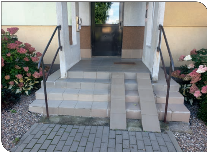
Różane 4 - schody przed remontem