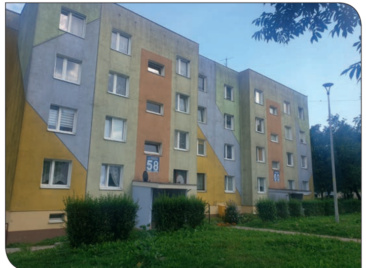
Staszica 58-60 - elewacja przed remontem