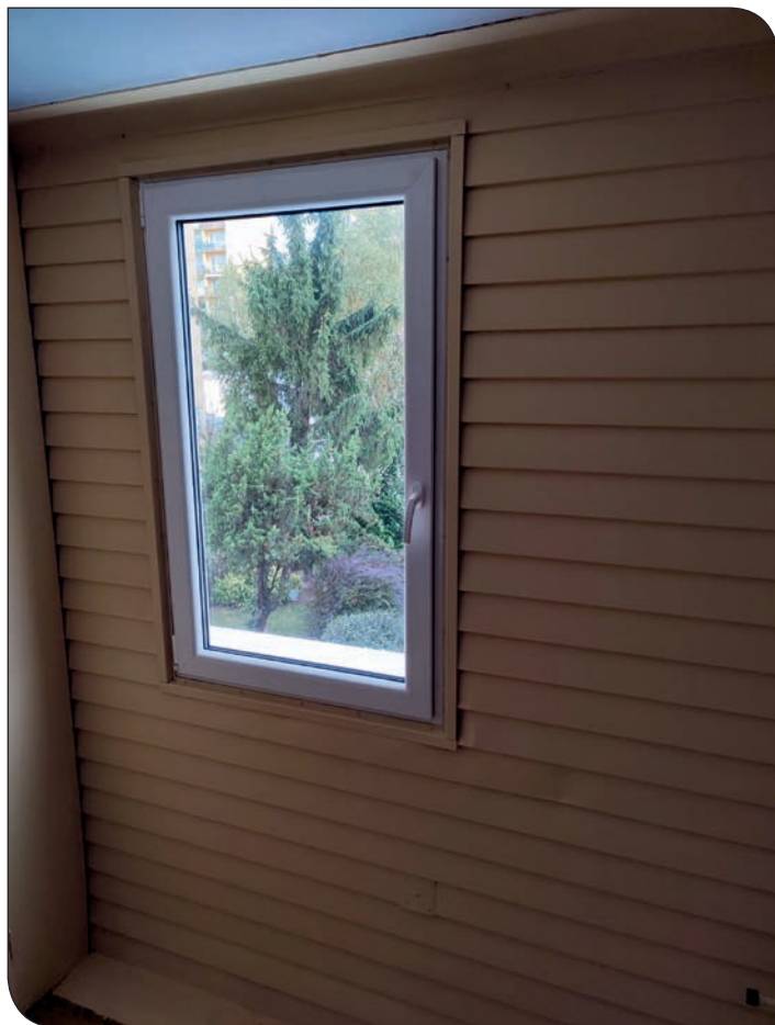
Różane 22b - po wymianie okna i malowaniu ściany